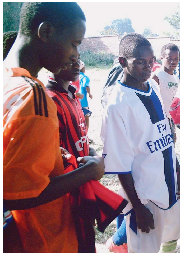
TOURNOI Question de ne pas faire de jaloux, les maillots serviront de prix lors d'un tournoi régional.